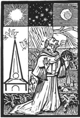
Parochie St. Franciscus van Assisië Localie St. Pancratiuskerk