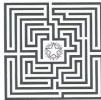
Wergroep Thomasviering Haaksbergen